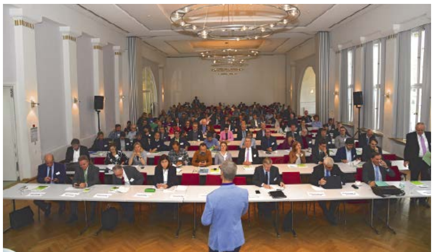
Mehr als 200 Teilnehmer besuchten den 2. Kongress „Phosphor – Ein kritischer Rohstoff mit Zukunft“ in Stuttgart Bad Cannstatt

Die Europäische Kommission hat im Rahmen ihrer Pläne zur Kreislaufwirtschaft einen Vorschlag für neue Vorschriften für organische und abfallbasierte Düngemittel in der EU vorgelegt. Ziel des Verordnungsentwurfs ist es, diesen den Zugang zum EU-Binnenmarkt erheblich zu erleichtern und sie traditionellen, nichtorganischen Düngemitteln gleichzustellen. Die Kommission hat damit die Rahmenbedingungen für eine Rückgewinnung