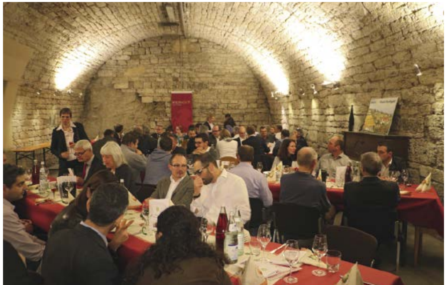
Gemütliche Weinprobe im Weingut der Stadt Stuttgart